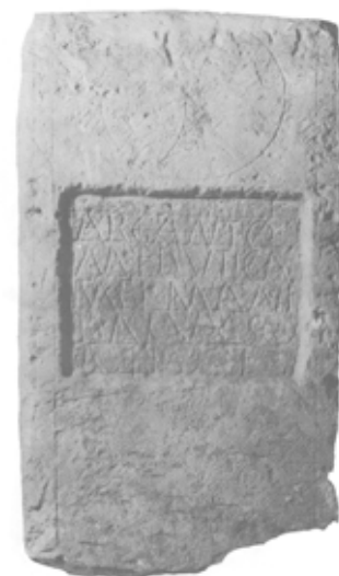
Fig. 17.- Inscripción romana de Riba de Sacres (nº 22). A. 1/3 de su tamaño aprox.