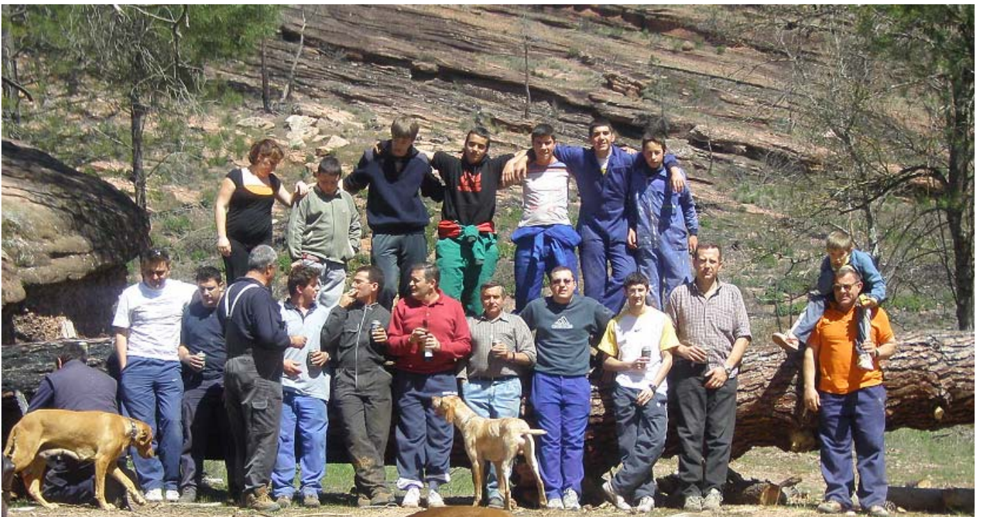
Foto de la Corta del Mayo 2008