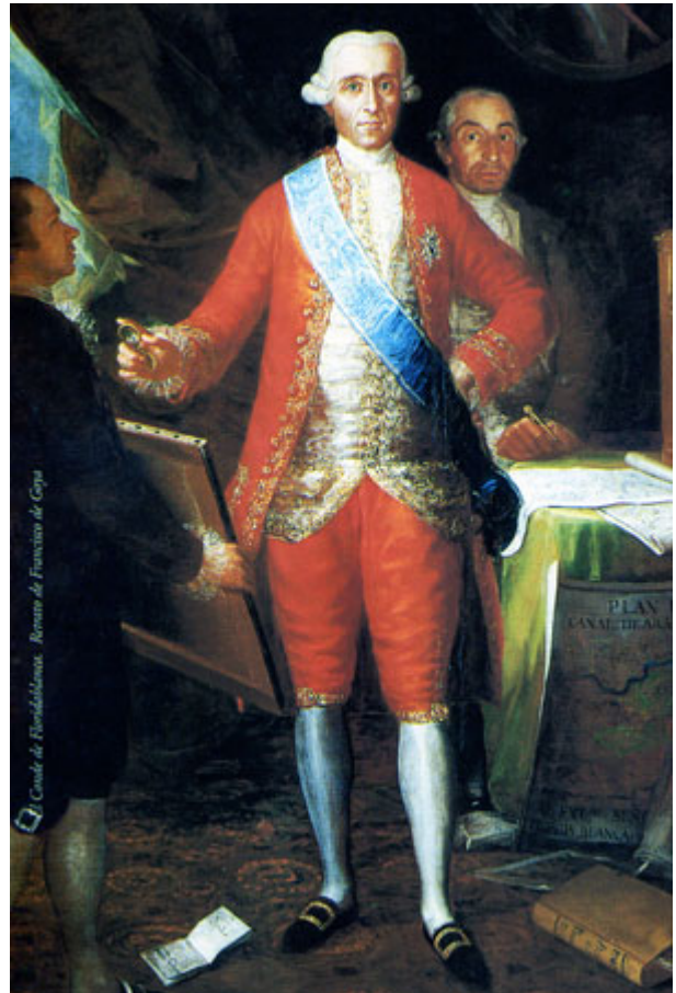
Conde de Floridablanca. Retrato de Francisco de Goya

Riba de Saelices se encontraba en la Intendencia de Soria, concretamente en la demarcación del Ducado de Medinaceli. Nuestra población contaba por aquel año con 227 vecinos. Siendo 119 varones y 108 mujeres.