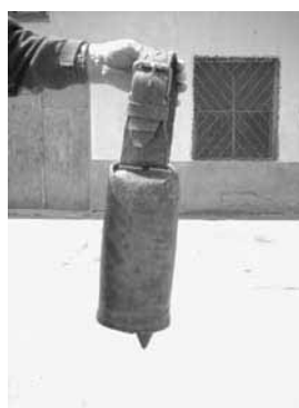
Figura 4: Cañón