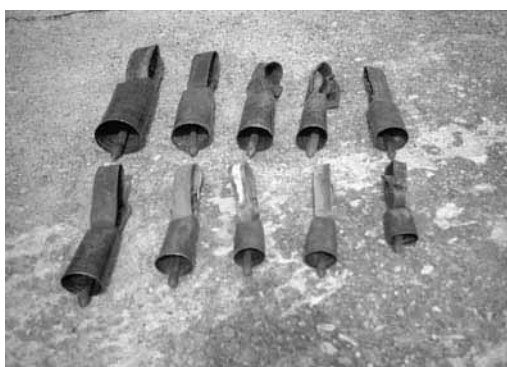
Figura 5: Cencerros utilizados por cabras

De toda la clasificación eran los más grandes. Colgado para el verano. Debido a que las vacas los arrastraban, solía ponerse a las cabras fuertes y a los machos que habían sido capados, los llamados capones.