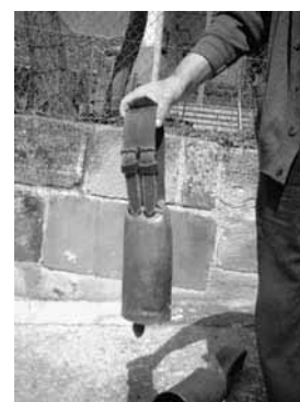
Figura 3: Arriera