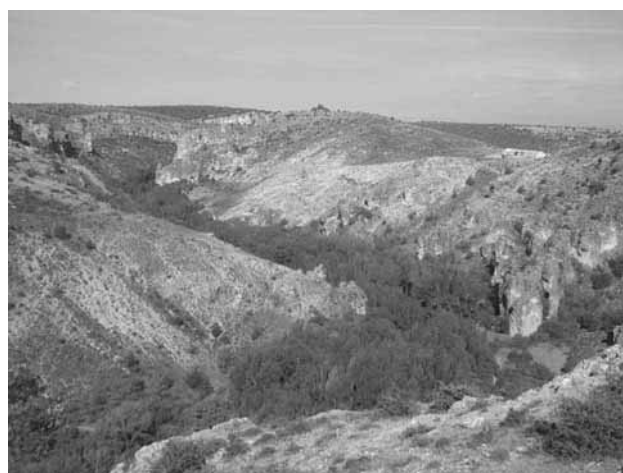
Figura 1: Vista derecha desde el Mirador

Ya en Peregrina pudimos disfrutar de un agradable paseo por la ribera del Río. Posteriormente comimos en el restaurante “El Paraíso”, dónde degustamos Migas Castellanas y Cordero. Ya por la tarde, visitamos en primer lugar a Hita admirando su arquitectura medieval y posteriormente VII Feria Agrícola y de Desarrollo Rural (FAGRI) que se celebraba en la localidad de Jadraque .