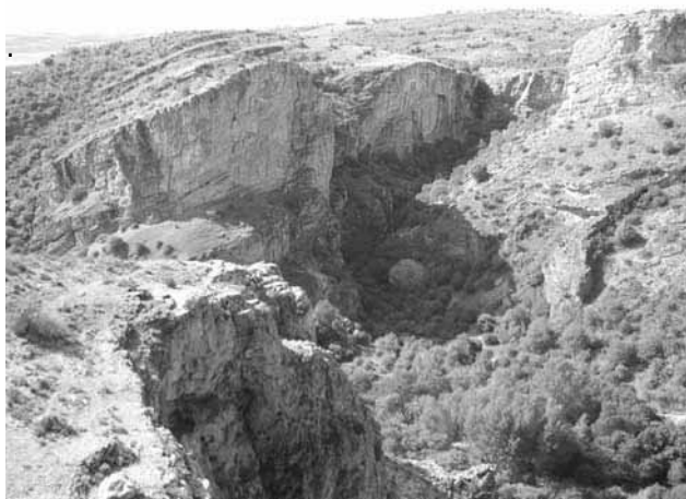
Figura 2: Vista izquierda desde el Mirador de Pelegrina

La excursión tuvo una primera parada en el Mirador de Pelegrina , donde hay un monumento en honor a Félix Rodríguez de la Fuente y desde el que se puede apreciar la belleza del valle (Figura 1 y 2) con el contraste entre el verde de la vegetación de la ribera del río y el gris de los peñascos. En la vista izquierda se pueden apreciar los riscos donde se rodó la famosa escena del águila.